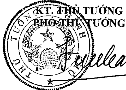
Lê Minh Khái