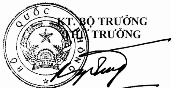
Thượng tướng Bé Xuân Trường

11.5. Những trường hợp phải kiểm định bất thường, thực hiện theo quy định tại 4.4 Quy trình này ✓