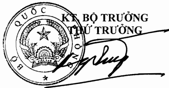
Thượng tướng Bé Xuân Trường