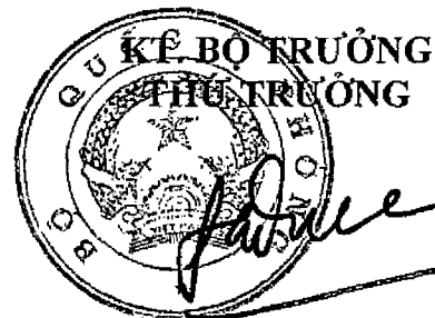
Thượng tướng Lê Hữu Đức