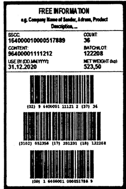
Hình 1 – Ví dụ về pa-let sản phẩm sữa