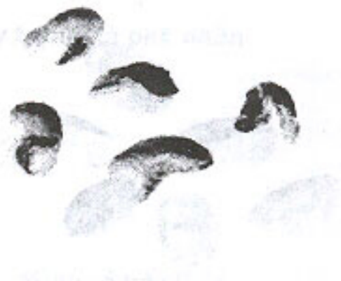
Nhân bị xây xát (3.6)