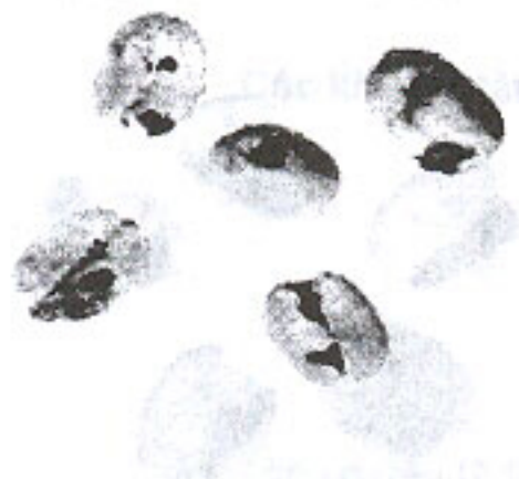
Nhân bị côn trùng gây hại (3.4)