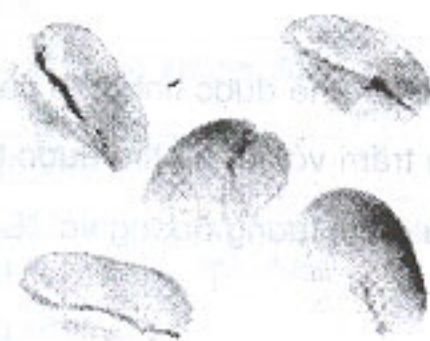
Nhân còn vỏ trấu (2.1)