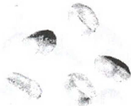
Nhân bị đốm (4.7)