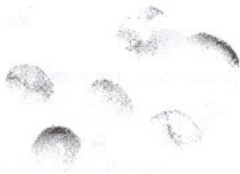
Nhân màu hổ phách (4.4)