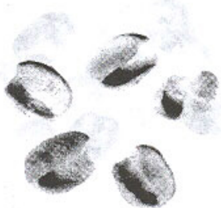
Nhân dị tật (nhân rồng ruột) (3.1)