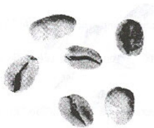
Nhân nâu (4.3)