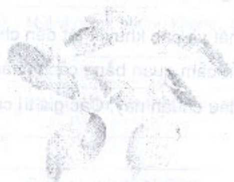
Mảnh vỏ trấu (2.2)