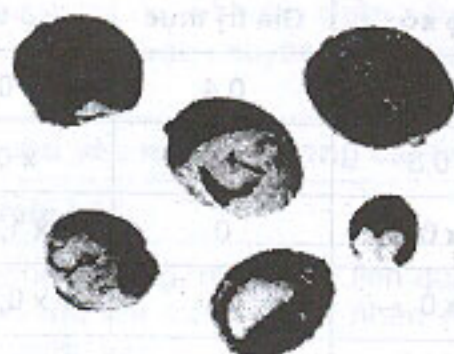
Quả khô (2.3)