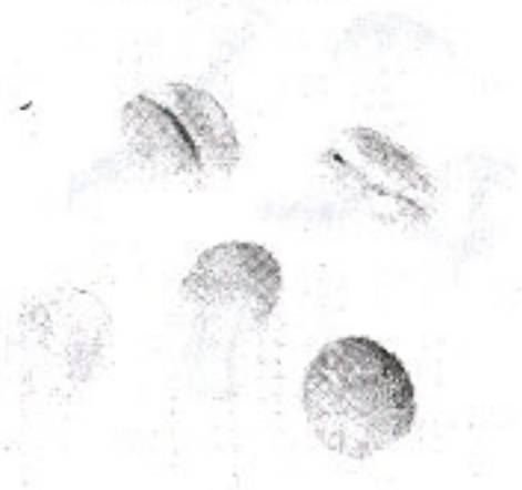
Nhân non (4.5)