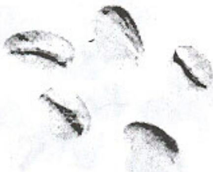
Nhân trắng xốp (4.9)