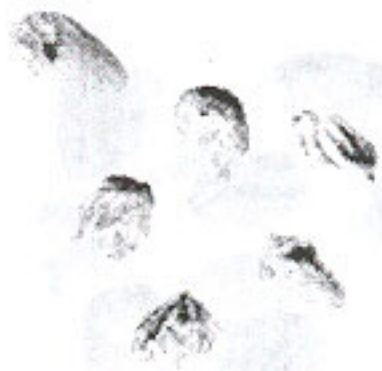
Nhân bị khô héo (4.8)